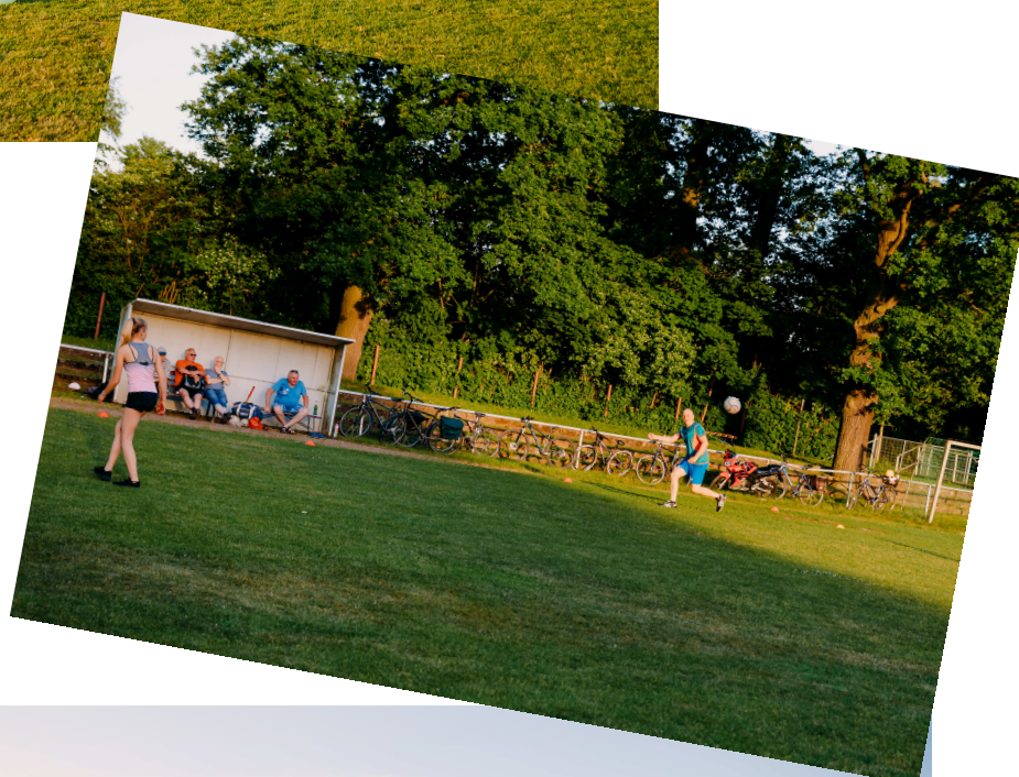
Wetter und Rasen topp