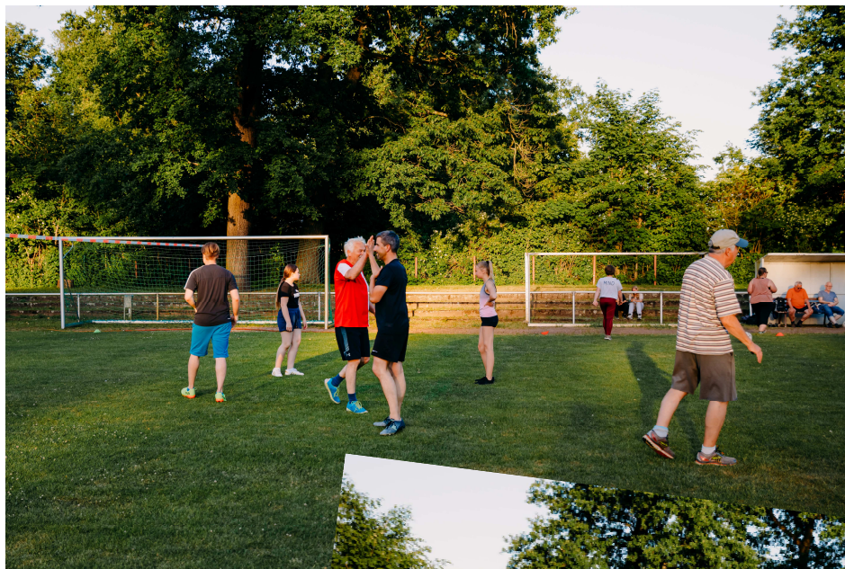
Seitenwechsel mit Abklatschen