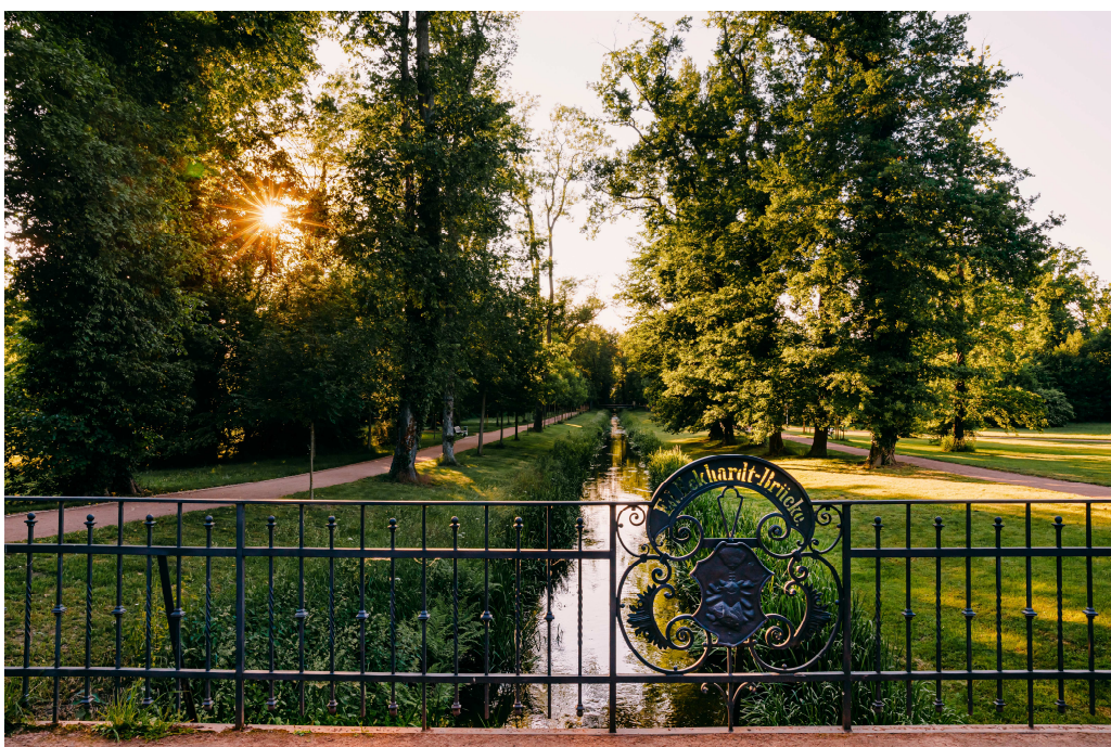
Die Große Röder fließt durch die Parkanlage