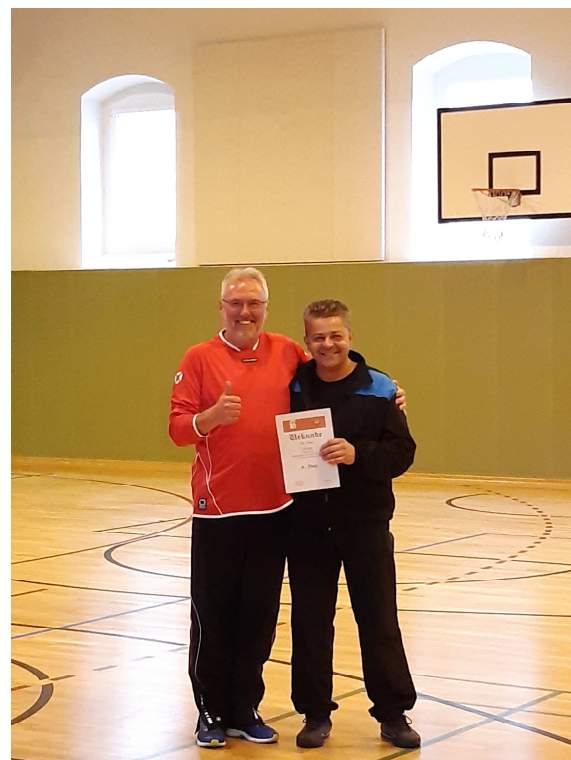
4. Team Störzel