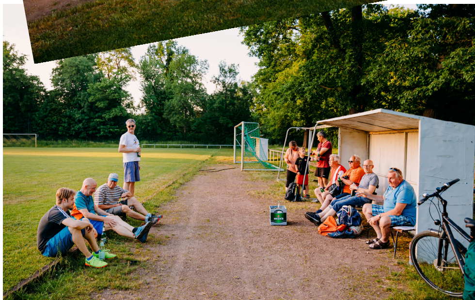
Auswertung nach Training und Spiel traditionell mit einer Flasche Radler oder Bier