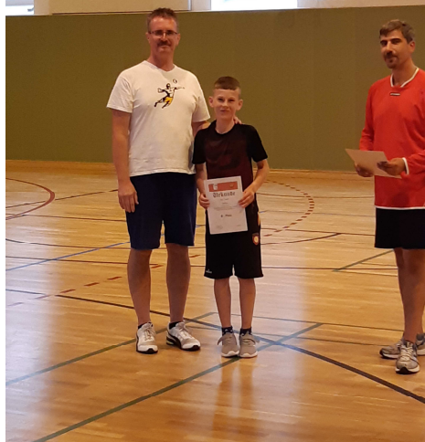
8. Team Müller