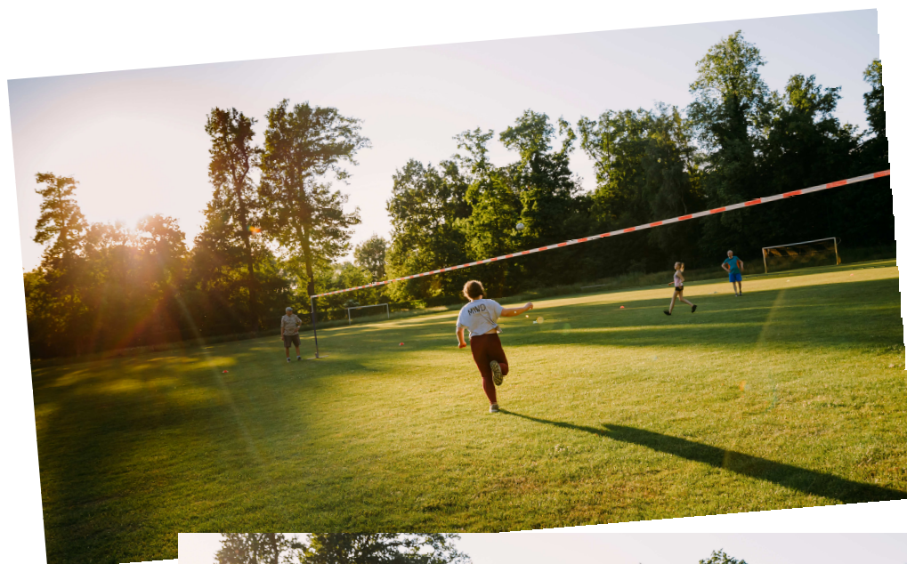
Emma läuft ein