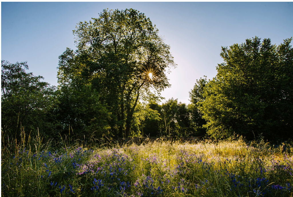
Eine Perle der Natur – Unser Stadtpark